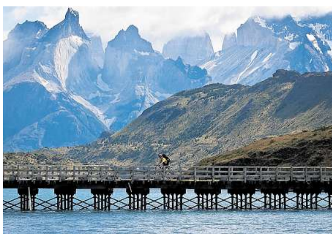
Krásný kout Země Patagonian Expedition Race zavede účastníky do míst, kam by se jinak podívali jen stěží.

Palončy může čerpat z loňských zkušeností, kdy startoval v mezinárodním týmu Four Continents. Tehdy závod nedokončili, letos dostal nabídku od finskoamerického seskupení Team Ulkoilun Maailma.fi a věří v úspěch. „Neměl jsem start v plánu, ale oslovil mě tým, který má silné ambice. Loni dorazi-